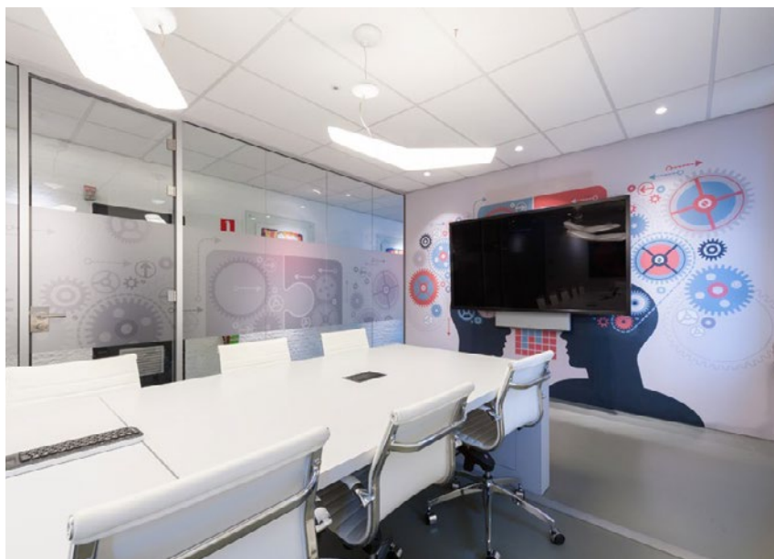
In de presentatieruimte wordt de sfeer doorgetrokken en weergegeven op een akoestische sfeervisual op de wand.

Er wordt veel gewerkt met interieurfolies van verschillende merken en ook glasfolies worden op allerlei plekken toegepast. Stam: "Bij het werken met interieurfolie is het belangrijk dat je klanten vooraf goed informeert over wat ze kunnen verwachten en welke voordelen het heeft om bij renovatieprojecten of zelfs nieuwbouw projecten interieurfolie toe te passen. Er zijn helaas bedrijven die zonder veel kennis van zaken incidenteel interieurfolies verwerken, dan krijg de klant niet de uitstraling die hij had verwacht." Het is één van de redenen waarom er in de beperkte ruimte van het eigen kantoor verschillende interieurfolies