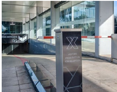
Herkenbare aanduiding van de ingang van de parkeergarage op weerbestendige dibond panelen.