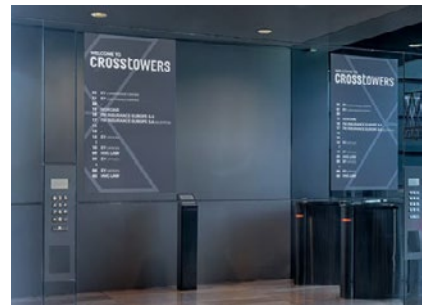
FC print op semi-permanent vinyl om wisselingen gemakkelijk uit te kunnen voeren in de Crosstowers op de Zuidas in Amsterdam.

Stam: "Wat we bij LBS doen is ongelooflijk breed. Er zijn projecten waarbij we wel tot 50 verschillende toeleveranciers inzetten om het project te realiseren. Daar ligt onze kracht. We kiezen steeds voor de materialen en de uitvoering die het beste aansluit op de wensen van onze klanten." Het verklaart waarom de eigen werkplaats plek biedt voor het voorbereiden van het werk terwijl er geen printer of plotter te bekennen valt. Stam: "Als we de diversiteit, die we kennen in onze opdrachten, zouden vertalen in een eigen machinepark zou