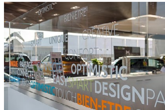
Kenmerkende kreten van Citroën in de showrooms op de glaswanden om het Feel Good concept te benadrukken.

mensen laat doen waar ze goed in zijn geeft dan geeft hen dat het meeste plezier in hun werk, wat ze vervolgens uitstralen naar onze opdrachtgevers. Wat mij betreft is de term signmaker te generiek voor wat nodig is." De externe medewerkers die LBS inschakelt hebben genoeg ervaring om hun werk zelfstandig uit voeren of elkaar aan te sturen. Ze hebben daardoor genoeg aan korte werkinstructies.